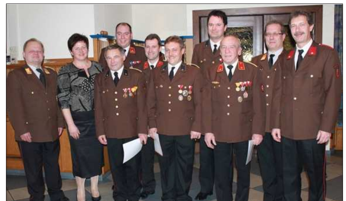
Freiwillige Feuerwehr Kematen

Im Rahmen der Jahreshauptversammlung der Feuerwehren Kematen, Achleiten und Gerersdorf wurde für die freiwillige und langjährige Arbeit im Kommando das Ehrenzeichen der Gemeinde feierlich überreicht. Auch der Abschnittskommandant Minichberger und der Bezirksfeuerwehrkommandant Lehner gratulierten den Ausgezeichneten sehr herzlich. In meiner Ansprache betonte ich besonders die Leistung, in vorderster Reihe in einer Führungsposition die Verantwortung zu übernehmen sowie im wichtigen Augenblick des Einsatzes auch rasch eine Entscheidung zu treffen, zum Teil auch mit persönlichen Konsequenzen im Fall des Falles. Solange wir solche Menschen um uns haben, mach ich mir um die Zukunft keine Sorgen. Herzliche Gratulation an die Geehrten!