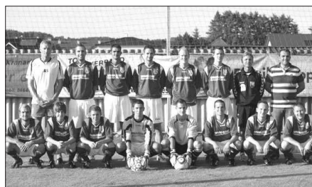
Unsere Kampfmannschaft – Saison 2010/2011