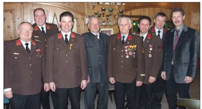
Freiwillige Feuerwehr Gerersdorf

Im Rahmen der Jahreshauptversammlung der Feuerwehren Kematen, Achleiten und Gerersdorf wurde für die freiwillige und langjährige Arbeit im Kommando das Ehrenzeichen der Gemeinde feierlich überreicht. Auch der Abschnittskommandant Minichberger und der Bezirksfeuerwehrkommandant Lehner gratulierten den Ausgezeichneten sehr herzlich. In meiner Ansprache betonte ich besonders die Leistung, in vorderster Reihe in einer Führungsposition die Verantwortung zu übernehmen sowie im wichtigen Augenblick des Einsatzes auch rasch eine Entscheidung zu treffen, zum Teil auch mit persönlichen Konsequenzen im Fall des Falles. Solange wir solche Menschen um uns haben, mach ich mir um die Zukunft keine Sorgen. Herzliche Gratulation an die Geehrten!