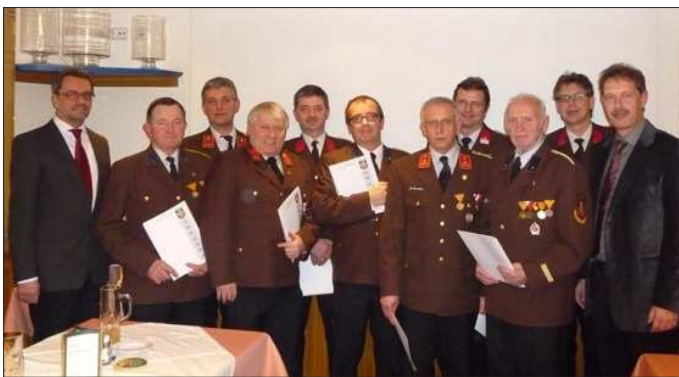
Freiwillige Feuerwehr Achleiten