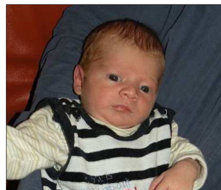
Felix Astleithner Kematen, Auweg 8